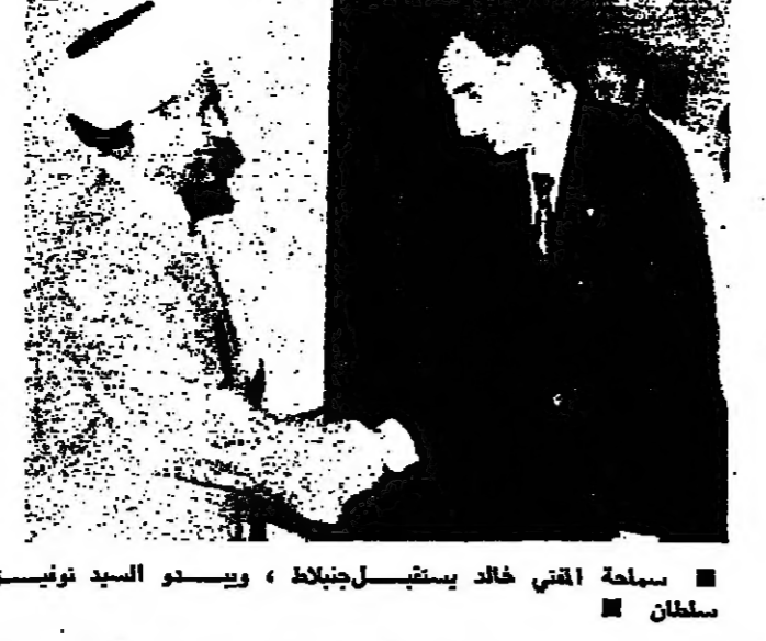
سماحة المفتي خالد يستقبل جنبلاط ، ويبدو السيد تونسيق سلطان

الاشغالات الثقافية والاجتماعية والاجتماعية وممثلي الجمعيات والهيئات الثقافية والاجتماعية . وقد لعلمت على تايين النقطه الكيرة عند بن الخياط بمطون وزارة العمل وتفدية الالباء ولجنة الامهات وجمعية حفاضة الطفيل والاتحاد النسائي الطائفي .